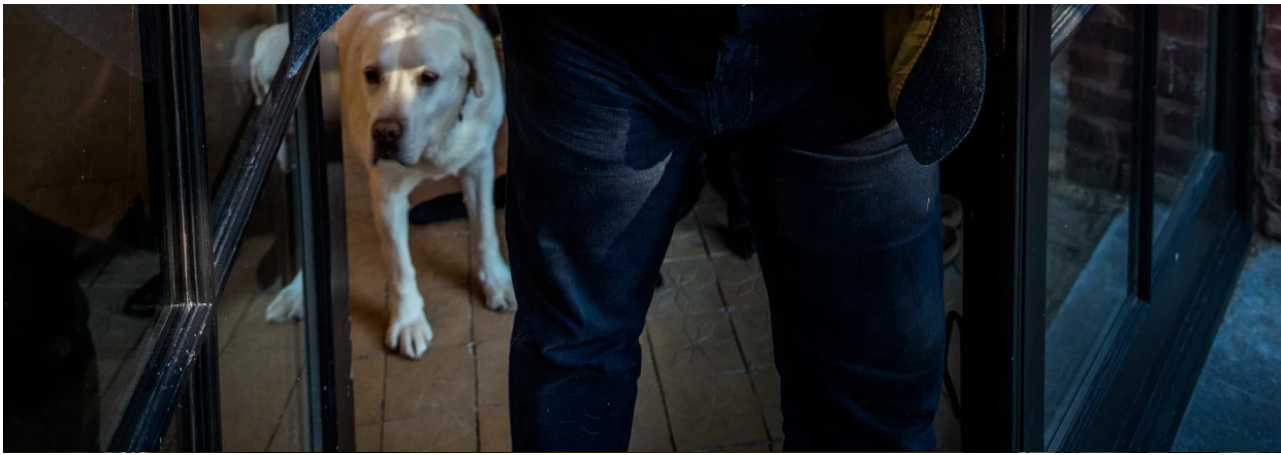
Frans Timmermans: 'Ik denk dat de mensheid niet eerder voor zo'n uitdaging heeft gestaan.'

Natuurlijk is de klimaatop in Glasgow van groot belang, zegt Frans Timmermans, leider van de EU-delegatie. Maar we moeten niet doen alsof alles ervan afhangt. Dat leidt alleen maar tot klimaatwanhoop, of juist berusting in ons lot. Als we de klimaatdoelen willen halen – en dat kan nog steeds – moeten we eraan blijven trekken.